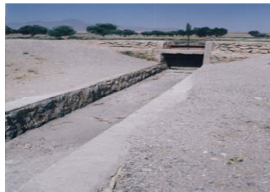
شکل ۱: وضعیت پوشش بتنی (سمت چپ) و سنگ وملات (سمت راست) در منطقه

راندمان انتقال در این نوع پوشش، همان‌طوری‌که مشاهدات عینی و نتایج آزمایش‌های انجام شده روی مغزه‌های بتنی نیز نشان داد، ترک خوردگی و تخریب بتن بر اثر کیفیت نامناسب اجرا و ذوب و یخ‌بندان‌های متوالی در اقلیم سرد منطقه و مقاومت فشاری پائین می‌باشد. نتایج پژوهش‌های مشابه انجام شده توسط رمضانیان‌پور وشاه‌نظری (۱۳۶۸)، گلابتون‌چی و طالبی (۱۳۷۹)، عباسی (۱۳۷۹)، مامن‌پوش (۱۳۷۸) و تریانتافیلیس (۱۹۹۰) نیز این مسئله را تایید می‌نماید. راندمان انتقال در کانال‌های سنگ و ملات بین ۹۲/۱ تا ۹۷/۲ درصد در نوسان بوده و به‌طور میانگین ۹۴/۴٪ می‌باشد. علت بالا بودن راندمان در این نوع پوشش‌ها دوام و استحکام مناسب آن در شرایط اقلیم سرد منطقه و انعطاف‌پذیری بیشتر این نوع پوشش در مقابل تغییر شکل‌های بستر می‌باشد. راندمان انتقال در کانال‌های خاکی با بافت‌های مختلف ۴۰٪ تا ۹۵/۶٪ و به‌طور میانگین ۶۶/۶٪ می‌باشد. این مقادیر با نتایج پژوهش سلطانی و معروفی (۱۳۸۵) و سپاس‌خواه و سالمی (۲۰۰۴) هماهنگی دارد. نوسان زیاد این پارامتر در کانال‌های بدون پوشش به دلیل تغییر قابل ملاحظه بافت خاک بستر کانال‌ها می‌باشد. با مقایسه مقادیر راندمان انتقال در جدول ۲ ملاحظه می‌گردد که متوسط راندمان انتقال آب در کانال‌های بدون پوشش و بتنی اختلاف کمی داشته و پوشش سنگ وملات اختلاف زیادی با آن‌ها دارد که بیانگر ناسازگاری شرایط منطقه با پوشش بتنی (پوشش سخت) و سازگاری با پوشش سنگ و ملات در کانال‌های آبیاری می‌باشد.