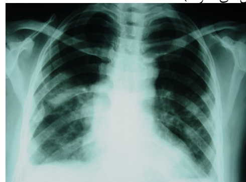
شکل ۱- رادیوگرافی قفسه سینه

این مدت ۱۰ کیلوگرم کاهش وزن داشت. علی‌رغم دریافت آنتی‌بیوتیک‌های مختلف به صورت سرپایی بهبودی حاصل نکرده و بستری گردید. وی سابقه دیابت، فشار خون بالا و هیپرلیپیدمی از چهار سال قبل داشته و تحت درمان با گلی‌بن‌کلامید، متفورمین، آمیلودیپین و جمفیروزیل بود. بیمار خانه‌دار بوده و سابقه تماس با عوامل آلاینده محیطی را نداشت. در معاینه، دمای بدن ۳۸/۵ درجه سانتی‌گراد بود، ضایعه پوستی و لنفادنوپاتی محیطی وجود نداشت. در معاینه قفسه سینه مختصر کراکل خشن به طور پراکنده سمع شد، کبد و طحال اندازه طبیعی داشتند. رادیوگرافی و سی‌تی‌اسکن قفسه سینه بیمار، ندول‌های متعدد دوطرفه، بیشتر در لوب‌های فوقانی را نشان داد. لنفادنوپاتی مدیاستینال و پلورال افیوژن وجود نداشت (شکل‌های ۱ و ۲).