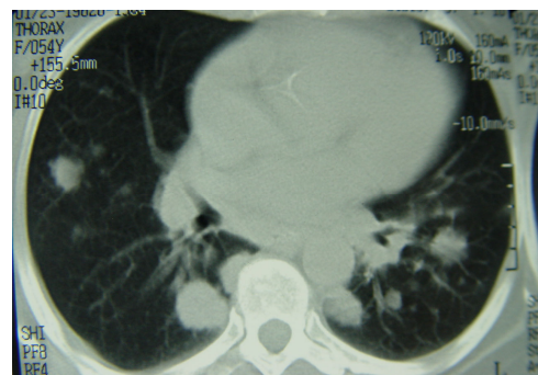
شکل ۲- سی‌تی‌اسکن قفسه سینه

سونوگرافی و سی‌تی‌اسکن شکم و لگن، اکوکاردیوگرافی و ماموگرافی طبیعی بود. فرمول شمارش خون، تجزیه ادرار و تست‌های عملکرد کلیه، کبد و LDH طبیعی و سدیمان ۱۰۵ بود. تست PPD (Purified Protein Derivative)، اسمیر و کشت خلط از نظر باسیل سل منفی بود. آزمایش‌های مربوط به بیماری‌های روماتیسمی همگی منفی بودند. آسپیراسیون و بیوپسی مغز استخوان طبیعی بود. جهت بیمار برونکوسکوپی فیبراپتیک انجام شد که ضایعه داخل برونش مشاهده نگردید. نمونه لاواژ مایع برونکوالوئولار از نظر باسیل سل، باکتری‌های پیوژن، قارچ و سلول‌های بدخیم منفی بود. بررسی نمونه بیوپسی ریه از طریق برونش کمکی به تشخیص نکرد. بررسی سیتوپاتولوژی نمونه‌های به دست آمده به روش بیوپسی تحت سی‌تی‌اسکن نیز تشخیصی نبود. لذا جهت بیمار بیوپسی باز ریه از طریق توراکتومی انجام شد. در آزمایش میکروسکوپی، نمای بافت ریه با تجمع هتروژن سلولی شامل سلول‌های کلاسیک و چند هسته‌ای ریداشتنبرگ در میان سلول‌های التهابی واکنشی مانند لنفوسیت، پلاسماسل، ائوزینوفیل و پلی‌مورفونوکلر دیده شد (شکل ۳).