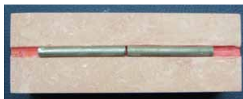
تصویر ۱: ایندکس گچی و نمونه‌ها

نمونه‌های تهیه شده بوسیله دیسک Cr-Co به ضخامت ۰/۳ میلی متر که بر روی دستگاه Nonstop نصب شده بود به دو قسمت مساوی تقسیم شدند. بدین ترتیب برای هر گروه مورد مطالعه تعداد ۳۰ قطعه ۳۰ میلیمتری تهیه شد. به منظور اتصال نمونه‌ها به یکدیگر (در هر دو گروه) و ثابت کردن نمونه‌ها در فاصله مناسب از یکدیگر، یک ایندکس گچی بصورت یک سکوی آماده شد. طوری که نمونه‌ها در راستای مستقیم قرار بگیرند. برای تنظیم نمونه‌ها در فاصله مناسب از یکدیگر، صفحه‌ای به ضخامت ۰/۳ میلیمتر در حد واسط دو میله قرار گرفت و انتهای میله‌ها توسط موم چسب داغ به گچ زیرین متصل شد (تصویر ۱).