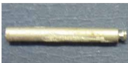
تصویر ۲: شکل آندرکات

در گروه Cast to، قبل از قرار دادن نمونه‌ها بر روی سکوی گچی، آندرکات مناسبی در انتهای هر میله ایجاد شد (تصویر ۲).