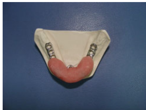
تصویر ۲: بیس آکریل خودپخت بر روی فریم فلزی