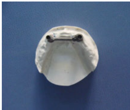
تصویر ۴: بار فلزی قرار گرفته روی کست تریم شده