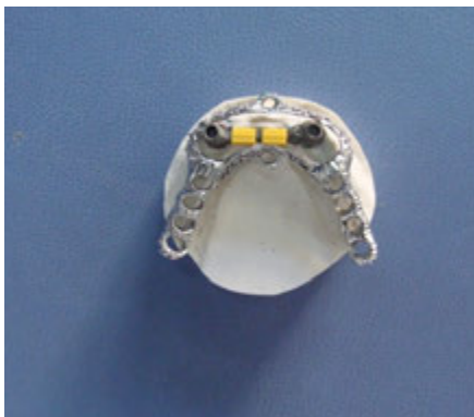
تصویر ۵: قرار دادن ۲ کلیپ بر روی بار پیش ساخته و قرار دادن فریم فلزی بر روی مجموعه