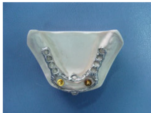
تصویر ۱: فریم ورک کروم کبالت بر روی کست ساخته شده است.