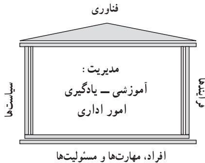
شکل (۱): مؤلفه‌های کلیدی مدارس هوشمند

نکته بسیار مهم در این نوع مدارس، تغییر شیوه یادگیری از شیوه مبتنی بر حافظه ۱ به شیوه مبتنی بر تفکر و خلاقیت ۲ است. در این راستا باید مؤلفه‌های کلیدی مدارس هوشمند به گونه‌ای متفاوت تعریف شده، و کارکردهای آن‌ها در مقیاسی جدید تبیین شود. در شکل شماره (۱) مؤلفه‌های کلیدی یک مدرسه هوشمند نشان داده شده است و در ادامه، کارکرد هریک از این مؤلفه‌ها تعریف می‌گردد (جک، مارشال، پن و وی، ۲۰۰۳).