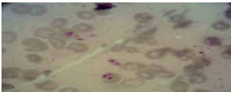
تصویر ۱: آماستیگوت لیشمانیا ماژور در نمونه تهیه شده از جوندۀ Meriones hurriane ، شهرستان جاسک، استان هرمزگان، ۱۳۸۷