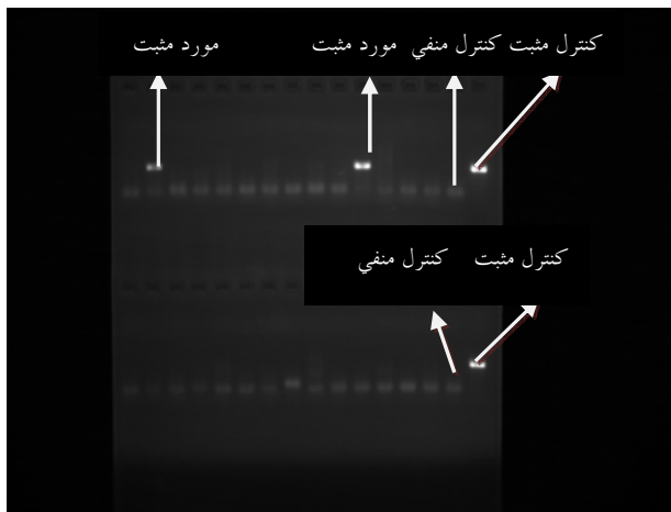
شکل ۲: در یک نوبت کاری دو مورد از مجموعه‌های سرمی دارای واکنش مثبت بودند که با علامت پیکان مشخص شده‌اند.