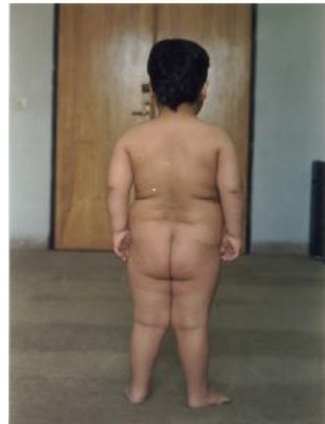
تصویر شماره 1- بیمار، پسر چهار و نیم ساله با الگوی چاقی

خویشاوندان مبتلا ازدواج خویشاوندی به جز مورد والدین بیمار دیده شد. چاقی و فشار خون بالا در بین والدین و خویشاوندان مشترک مادری و پدری بیمار شیوع بالایی دارد. شواهد حاکی از هتروزیگوت ناقل بودن والدین برای ژن معیوب می باشد. از آنجا که ریسک تکرار بیماری برای فرزندان بعدی 25% میباشد، لذا توصیه های لازم به والدین صورت گرفت.