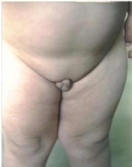
تصویر شماره 3- هیپوگنادیسم