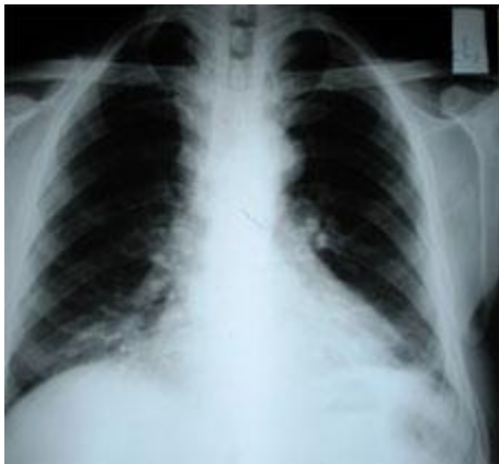
شکل شماره 1- وجود توده در مدياستن قدامی فوقانی بیمار

بیمار مردی 61 ساله که با توده قدام گردنی از چند سال قبل که از حدود 6 ماه پیش از مراجعه بدنبال فعالیت دچار خس خس سینه و تنگی نفس می گردید. در بررسی انجام گرفته در CXR توده در مدياستن قدامی فوقانی بیمار دارد شکل (1).