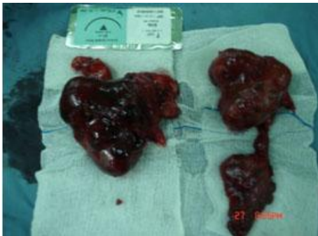
شکل شماره 5- خونگیری توده در محل تیموس در مدیاستن قدامی از عروق داخل قفسه صدی از شریان و ورید