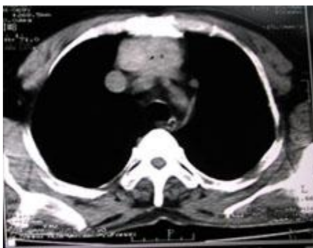
شکل شماره 2- توده بافت نرم در مدياستن قدامی فوقانی در سی تی اسکن

در سی تی اسکن انجام گرفته از قفسه صدري یک توده بافت نرم به ابعاد 60 \times 40 \times 85 mm در مدياستن قدامی فوقانی در قدام تراشه و در خلف استرنوم با گسترش تا حد کارینا گزارش گردیده است. شکل (2).