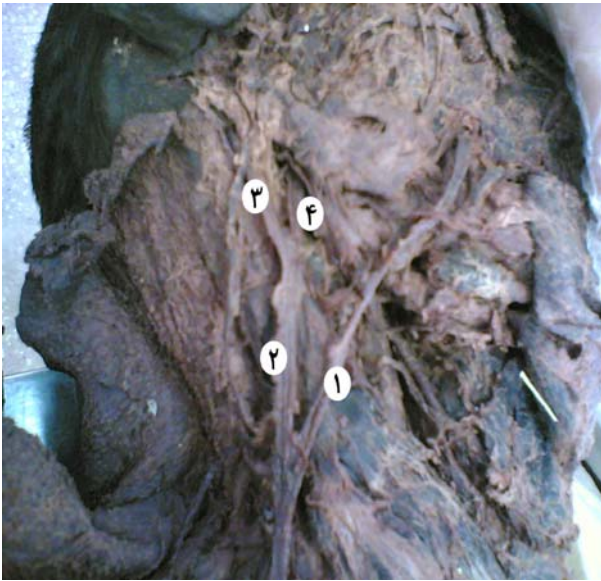
شکل ۱. ۱- ورید صورتی ۲- ورید ژیگولار خارجی ۳- ورید خلف گوش ۴- ورید رترومندیولار

تحتانی مثلث خلفی گردن به ورید ساب کلاوین تخلیه شده بود (شکل ۲). در طرف دیگر گردن، ورید صورتی پس از تشکیل و طی مسیر طبیعی خود با پیوستن به شاخه قدامی ورید رترومندیولار، تشکیل ورید صورتی مشترک را داده و به ورید جوگولار داخلی تخلیه شده بود.