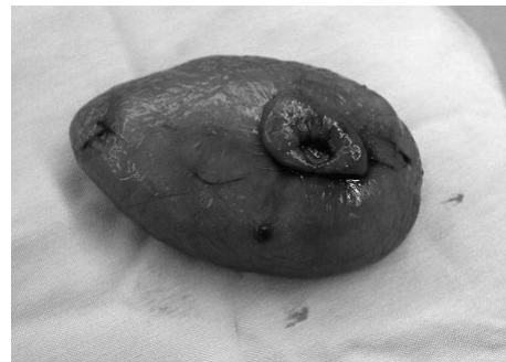
شکل ۳: لیپوم معده: نمای توده بعد از برداشتن

بیمار با تشخیص لیپوم (یا لیومیوم) تحت عمل جراحی گاسترکتومی (با میدلا این لاپاراتومی)، برداشتن تومور و ترمیم معده در ۲ لایه قرار گرفت و بیوپسی های متعدد از ناحیه برداشته شد و با پاتولوژی لیپوم تأیید شد. حین جراحی، یک توده نرم به اندازه پرتقال در ناحیه پره پیلوریک لمس می شد. توده، مخاط و ناحیه اولسر برداشته شد (شکل ۳).