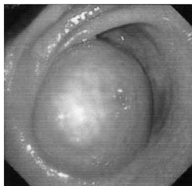
شکل ۱: لیپوم معده؛ توده زیر مخاطی تقریباً زرد رنگ با آندوتلیوم نرمال بدون زخم

بیمار آقای ۴۵ ساله ای است که با شکایت مدفوع قیری رنگ (ملنا) مراجعه کرده است. بیمار مورد شناخته شده دیابت شیرین است که مدتها تحت درمان با داروهای خوراکی کاهنده قند خون همانند گلی بن کلامید بوده است. مشکل بیمار از ۲ ماه قبل از مراجعه با مدفوع سیاه قیری آغاز شده است، در این مدت او مراجعات پزشکی مختلف داشته و درمان های گوناگون دریافت کرده است. بیمار سابقه تهوع، استفراغ و نفخ گهگاهی را در همین مدت ذکر می کند. علایم حیاتی در هنگام ورود عبارت بودند از: درجه حرارت: ۳۶/۹°C، تعداد تنفس: ۲۰ در دقیقه، تعداد ضربان قلب: ۸۵ در دقیقه، فشار خون: ۱۱۰/۶۵ میلی متر جیوه در معاینه، بیمار بدحال یا توکسیک به نظر نمی رسید و کاشکتیک نبود. در معاینه سر و گردن، بیمار مختصراً رنگ پریده بود، ملتحمه نیز رنگ پریده بود، ولی اسکلرا ایکتریک نبود. نکته مشکوک یا پاتولوژیک دیگری بدست نیامد. در معاینه قفسه سینه، دفورمیتی یا برجستگی خاصی مشاهده نشد. در سمع قلب، سوفل یا صدای اضافی سمع نشد. سمع ریه پاک، بدون رال، کراکل، ویزویا صدای اضافی بود. شکم نرم، بدون ارگانومگالی. لبه کبد ۱ سانتی متر زیر لبه دنده لمس شد ولی پهنای کبد نرمال بود. لمس شکم فاقد ریباند و گاردینگ بود. فقط در ناحیه اپیگاستر تندرنس واضح داشت. صداهای روده نرمال سمع شد. نتایج تست های آزمایشگاهی انجام شده برای بیمار در جدول ۱ خلاصه شده است. بیمار تحت آندوسکوپی فوقانی قرار گرفت که طی آن تومور زیر مخاطی در ناحیه پره پیلوریک با تشخیص تومور استرومایی معده-روده ای* (GIST) تومور لیومیوما مشاهده شد (شکل ۱).