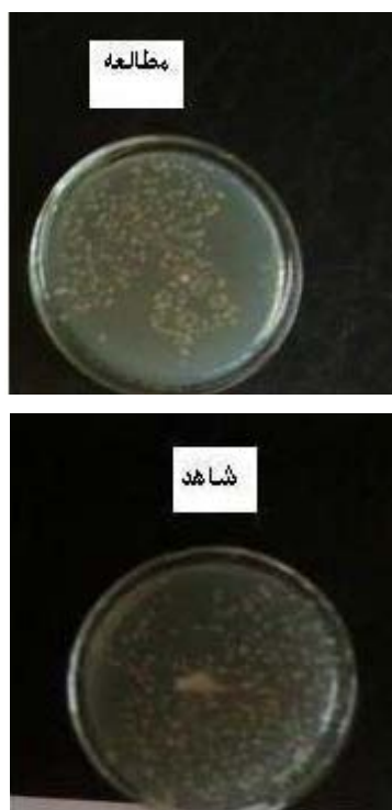
شکل ۱- کلنی‌های رشد یافته استافیلوکوکوس اورئوس در حضور ۰/۵ میلی تسلا میدان الکترومغناطیس و پلیت شاهد ( کلنی کانت بعد از رقیق سازی انجام گرفته است)

نتایج بررسی تاثیر جنتامایسین بر استافیلوکوکوس اورئوس در حضور ۰/۵ میلی تسلا میدان الکترومغناطیس (شدتی که خود آن بر رشد میکروب بی تاثیر بود) نشان داد و حداقل غلظت ممانعتی و حداقل غلظت باکتری کشی جنتامایسین در مقابله با استافیلوکوکوس اورئوس در حضور ۰/۵ میلی تسلا میدان الکترومغناطیس ۵۰٪ کاهش پیدامی کند (در گروه تحت مطالعه حداقل غلظت ممانعتی ۴ و حداقل غلظت باکتری کشی ۸ و در گروه شاهد حداقل غلظت ممانعتی ۸ و حداقل غلظت باکتری کشی ۱۶ میکروگرم بر میلی لیتر)، شکل ۲ و جدول ۳ نشان دهنده این موضوع می باشند.