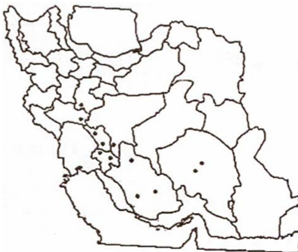
شکل ۳- پراکنش بیلهر در سطح ایران