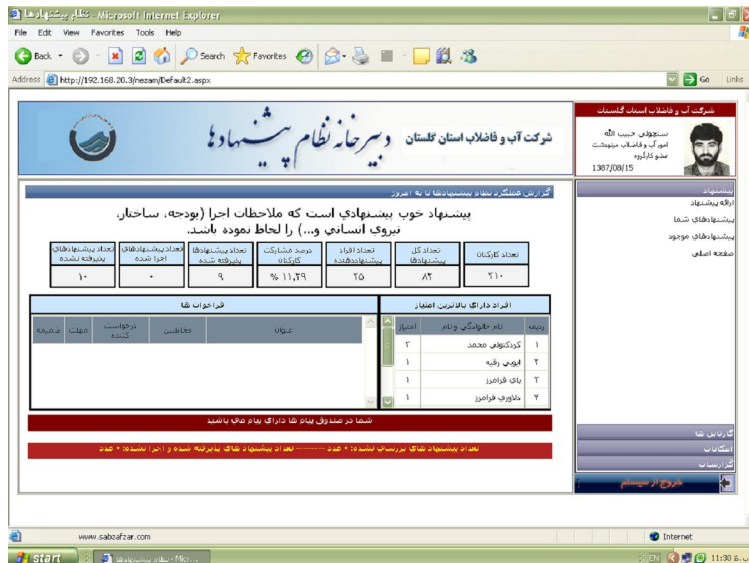
نمونه نرم افزار نظام پیشنهادات (شکل شماره 2)