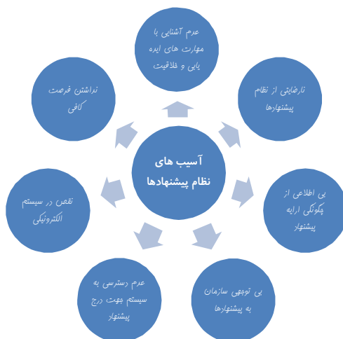
شکل یک: آسیب های موجود در سیستم نظام پیشنهادها [10]

درصدمده‌ای از کارکنان در بسیاری از سازمان‌ها که نظام پیشنهادها را به کار گرفته‌اند در یک سال کاری، اصلاً پیشنهاد ارایه نمی‌دهند. آخرین بررسی‌ها نشان می‌دهد که در صد مشارکت کارکنان در نظام پیشنهادها در 150 شرکت متوسط ایرانی 20 درصد بوده‌است. در واقع 80 درصد کارکنان در فرآیند پیشنهاد وارد نشده‌اند. در شکل یک هفت دلیل عمده ارایه شده که مانع از طرح پیشنهاد توسط کارکنان در سازمان‌ها می‌شوند: