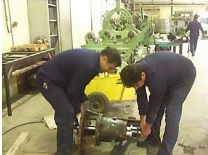
شکل ۱- تکنسین تعمیرات توربین

در شاغلین مورد مطالعه در شرکت مدیریت تولید برق امتیاز نهایی REBA دارای میانگین و انحراف معیار 9/94 \pm 2/12 و محدوده ۶-۱۳ بود. ارزیابی ریسک پوسچرهای کاری نشان داد که هیچ یک از وظایف در شرکت مدیریت تولید برق مورد مطالعه دارای سطح ریسک بسیار کم و کم نبودند و پوسچر کاری افراد با 15/51\% ، 33/62\% و 50/0\% به ترتیب دارای سطح ریسک متوسط، بالا و بسیار بالا بودند. در جدول ۴، امتیاز نهایی ارزیابی ریسک به روش REBA در وظایف مختلف آورده شده است. در شاغلین شرکت مدیریت تولید برق بین سن و سابقه کار با درد کمر، زانو و دست، ارتباط معنی‌داری یافت شد ( p < 0/05 ).