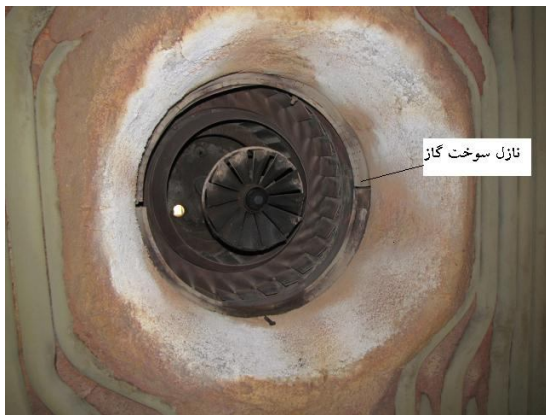
شکل ۲- نسوزکاری اطراف مشعل

شرکت سازنده بویلر نقشه هندسی خاصی جهت نسوزکاری اطراف مشعل‌ها ارائه کرده است. مطابقت ابعاد و طرح داده شده در نقشه و نسوزکاری فعلی مشعل‌ها نشان می‌دهد که تفاوت آشکاری وجود دارد. با توجه به اینکه در حال حاضر شعله مشعل‌ها به لوله‌های سوپرهیتر برخورد می‌نماید یکی از روشهای رفع و جلوگیری از برخورد، اصلاح هندسه نسوزکاری اطراف مشعل‌ها مطابق دستورالعمل سازنده می‌باشد (شکل ۲).