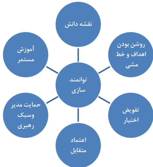
شکل 3: مدل پیشنهادی پژوهش

پژوهشگران مدل های مختلفی را برای توانمند سازی کارکنان و فرآیندهای مدیریت دانش ارائه داده اند. با بررسی های به عمل آمده در ابعاد و عوامل موثر بر توانمندسازی کارکنان، مدل زیر برای توانمندسازی کارکنان با محوریت مدیریت دانش طراحی و ارائه شده است.