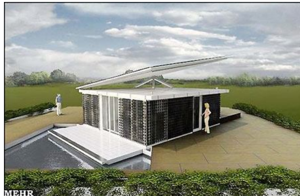
خانه خورشیدی با سقف متحرک

در میان طرح‌های ابداعی دانشجویان طرح تیم دانشگاه آریزونا بسیار جلب توجه می‌کند. این خانه از دیوارهای آبی برخوردار است که به عنوان گیرنده‌های حرارت خورشید مورد استفاده قرار می‌گیرند. این دیوارها از لایه‌های شیشه‌ای و آب تشکیل شده اند به این شکل حرارت از شیشه به آب رسیده و هوای میان دو لایه شیشه ای را گرم می‌کند. در شب هنگام که درجه حرارت هوا کاهش پیدا می‌کند این هوای گرم نمی‌تواند از شیشه خارج شده و در مجرای میان این دو لایه متراکم می‌شود. به این شکل می‌توان هوای گرم را در روزهای سرد به داخل خانه هدایت کرد.