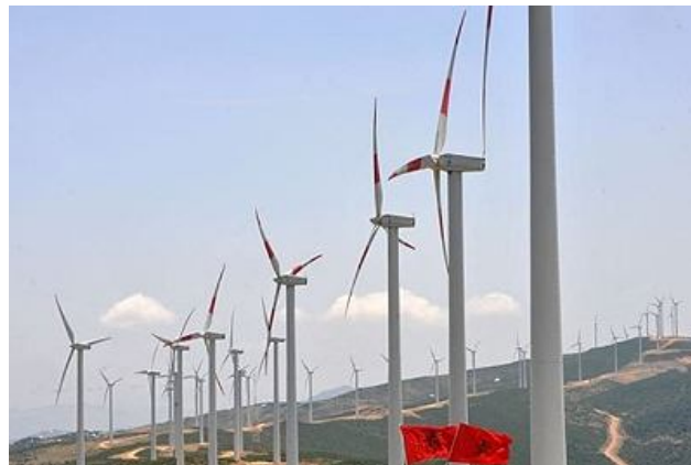
: نیروگاه بادی در "ظهر سعدین"

این طرح مغرب، گرچه بلندپروازانه به نظر می‌رسد، تنها بخشی از یک طرح بزرگتر است که بوسیله یک اتحادیه ۴۵ کشوری برای توسعه منطقه مدیترانه است، که شامل ۲۷ کشور اتحادیه اروپا و ۱۶ کشور مدیترانه‌ای است. همشهری آنلاین آب، خورشید و باد کد مطلب: ۱۱۷۸۵۳، زمان انتشار: شنبه ۱۷ مهر ۱۳۸۹ - ۰۰:۱۵:۴۴