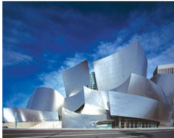
تالار کنسرت والت دیزنی

توجه به مسائل فرهنگی و محیط‌زیستی تنها عواملی نبوده‌اند که در شکل و نوع ساختمان‌هایی که در این دهه ساخته شده‌اند تأثیر گذاشته‌اند. یکی از موضوع‌هایی که همیشه در طراحی ساختمان‌های شهری مطرح بوده تعیین حدی مشخص برای ساختمان‌های بلند بوده، حدی برای بلندی آنها و حدی برای تعداد ساختمان‌های بلند یک شهر. ارتفاع زیاد ساختمان‌ها یا تعداد زیاد ساختمان‌های بلند باعث می‌شوند ساکنان شهر به راحتی آسمان را نبینند و این اتفاق در روحیه آنها و عملکردشان تأثیر زیادی می‌گذارد. با وجود این، همچنان در همه شهرهای بزرگ ساختمان‌های بلند ساخته می‌شوند و حتی تب آن به شهرهای کوچک‌تر هم کشیده شده است. مردم از این اتفاق به عنوان نشانه‌ای از امروزی شدن استقبال می‌کنند، بی‌خبر از تأثیری که روی آنها می‌گذارد و از این که دلیل اصلی این اتفاق به عنوان نشان‌دهنده‌ی تولید درآمد بیشتر برای سازندگان این ساختمان‌هاست. در حقیقت اقتصاد یکی از مهم‌ترین عوامل تعیین‌کننده در معماری است که همیشه خیلی از عوامل دیگر را تحت‌الشعاع قرار داده است. اما در دهه گذشته اتفاقی افتاد که دست‌اندرکاران و تصمیم‌گیرندگان را وادار کرد یک بار دیگر به موضوع تعیین حد برای ساختمان‌های بلند فکر کنند. ..