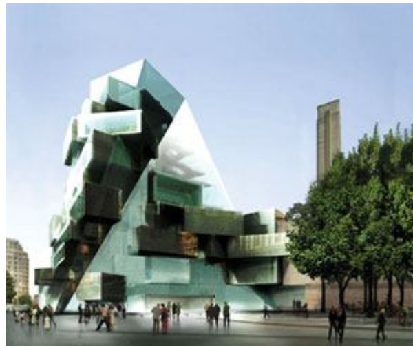
بخشی از موزه «تیت مدرن»

یکی دیگر از مهم‌ترین ساختمان‌هایی که در این دهه ساخته شده و توجه آدم‌ها را به حفظ محیط زیست از زاویه‌ای متفاوت نشان می‌دهد، بخش جدید موزه «تیت مدرن» لندن است این ساختمان را هم هرتزوگ و دُمرون طراحی کرده‌اند. آنها یک کارخانه قدیمی برق را که در کنار رودخانه تایمز لندن قرار داشت و سال‌های سال از آن استفاده نشده بود، به بخشی از این موزه تبدیل کردند. آنها با این ابتکار بی‌نظیر، با صرف انرژی و هزینه کمتر، ساختمان قدیمی خوب، اما بلااستفاده‌ای را به مرکزی فرهنگی تبدیل کردند؛ مرکزی که سالانه میلیون‌ها بازدیدکننده دارد و می‌تواند خیلی از اندیشه‌ها و دیدگاه‌های تازه را شکل بدهد. ... این اقدام نشان می‌دهد؛ این که آدم‌ها به فعالیت‌های فرهنگی اهمیت بیشتری می‌دهند و به تجربه می‌دانند که با ایجاد فرهنگی غنی‌تر می‌توانند خیلی از مسائل را به‌طور ریشه‌ای‌تر حل کنند.