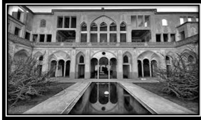
۲-۶- خانه عامری ها

از خانه تاریخی عامری ها با ۱۳ هزار مترمربع زیربنا و ۹ هزار مترمربع عرصه که دارای هفت حیاط و ۸۵ اتاق است، به عنوان بزرگترین خانه تاریخی کشور یاد می شود. این مجموعه نفیس در دوره زندیه احداث و در دوره قاجار به وسیله 'سهام السلطنه عامری' توسعه یافته است. قرینه‌سازی بسیار زیبا با گچ بری ها و نقاشی های بی‌بدیل و بی‌نهایت عالی این خانه را در زمره یکی از آثار منحصر به فرد کاشان قرار داده است. خانه عامری ها در مجموعه بافت تاریخی در خیابان علوی کاشان واقع شده است. (ایرنا، ۱۳۹۲)