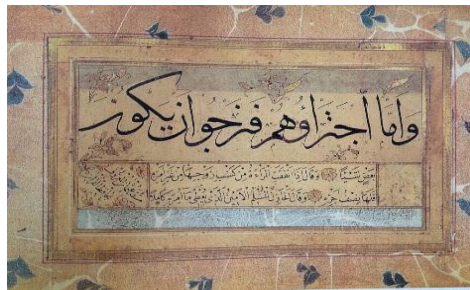
ت: 3 مرقع حافظ عثمان، مجموعه خلیلی، جلد 5

"قطعه نویسی رایج‌ترین اثر اندازه کوچک در مرقعات است. خوشنویسان عثمانی در قطعه نویسی، اشعار فارسی یا ترکی را مورب می‌نوشتند. کلمه قطعه در تلفظ ترکی کتیه می‌باشد و به آثاری اطلاق می‌شود که در آن یک سطر با خط جلی افقی با خط ثلث در بالا و چند سطر خفی با خط نسخ در زیر آن نوشته شده باشد. در این قالب دو فضای مستطیل شکل خالی در طرفین متن ایجاد می‌شود (تصویر شماره 4). خوشنویسان و کاتبان عثمانی در نوشتن کتیبه از آزادی عمل بیشتری برخوردار بودند. در قطعه نویسی دومین سطر جلی در زیر صفحه و سطور خفی گاه به صورت مورب نوشته می‌شد که در این صورت دو فضای مثلثی خالی در گوشه‌های سمت راست و سمت چپ بوجود می‌آمد. همچنین نام خوشنویس و رقم او در هر بخش از صفحه که مطلوب نظر هنرمند بود نگارش می‌شد و محدودیتی برای او وجود نداشت. این نوع قالب نوشتاری همچنان در قرن 10 ه.ق متداول بود." (همان: 128)