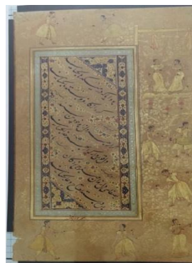
تصویر شماره 1 و 2 : مرقع گلشن، کتابخانه و موزه کاخ گلستان