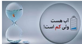
شکل 1: صرفه جوئی در مصرف آب 1

شرکت آبفا اخیراً در تبلیغات خود از جمله زیر استفاده می کند: آب هست ولی کم است ! این جمله این فرهنگ را القا می کند که مصرف کنندگان آب در مصرف ، رعایت صرفه جوئی را داشته و منابع آبی که آیندگان هم در آن سهمی دارند را درست مصرف کنیم و به فکر نسل آتی هم باشیم . اگر این شعار در عمل نمود عینی پیدا کند به یک توسعه پایدار خواهیم رسید.