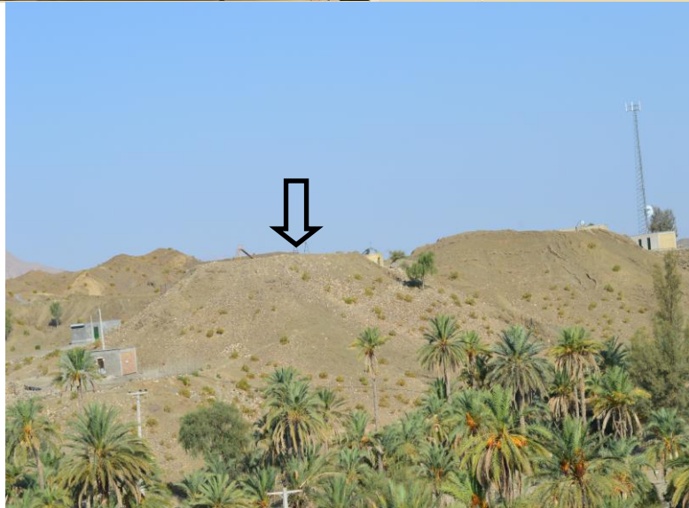
تصویر ۴. تپه سنگر دید از شرق، مأخذ: نگارنده، ۱۳۹۴.