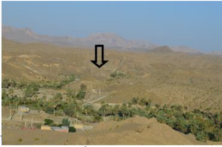
دورنمایی از کلات مارز، مأخذ: نگارنده، ۱۳۹۴.

استان کرمان با پیشینه‌ای کهن در جای جای آن منابع مختلف گردشگری، شامل جاذبه‌های طبیعی، فرهنگی و تاریخی گسترده شده است. یکی از این مکان‌ها دهستان مارز می‌باشد، که وجود کلات مارز (تصویر ۳) و تپه ای در مرکز دهستان (این قلعه) معروف به تپه سنگر (تصویر ۴) و هم چنین ده متروک شده بنگرو واقع در شمال شرقی دهستان مارز و روستاهایی هم چون درکلات، ناهوگان، کرچکان، نمگاز از دیگر مکان های گردشگری این دهستان هستند. اما در حال حاضر با توجه به نقش و اهمیت آن‌ها به نوعی مورد بهره‌برداری قرار نگرفته‌اند، و تاکنون در زمینه گردشگری و توسعه این دهستان هیچ برنامه صحیح و مدونی صورت نگرفته است.