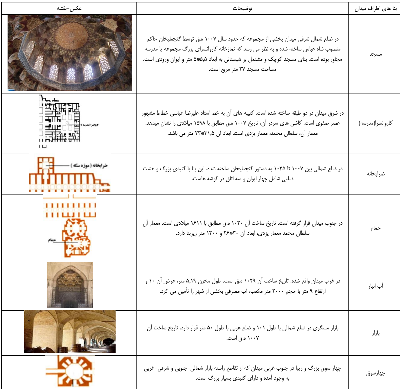
جدول ۱. عناصر میدان گنجعلیخان

میدان گنجعلیخان از جمله میادین بسته ای است که گرداگردش را بناهایی متفاوت محصور کرده است. زمان ساخت این میدان اوایل قرن یازدهم هجری (۱۷ میلادی) است. این میدان و مجموعه اطراف آن در دوره صفویه و در زمان حکمرانی گنجعلیخان بر کرمان و طبق دستور شاه عباس اول صفوی بنا گردید. گنجعلیخان با انتخاب بخشی از بازار که در محل تقاطع راسته بازارهای