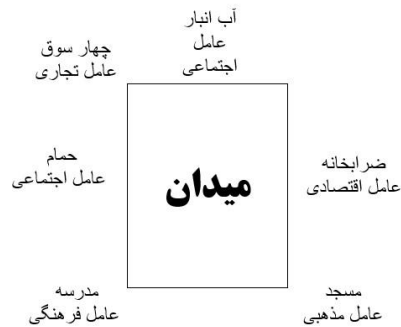
شکل ۲. عناصر میدان و عوامل اجتماعی، اقتصادی، تجاری، فرهنگی و مذهبی