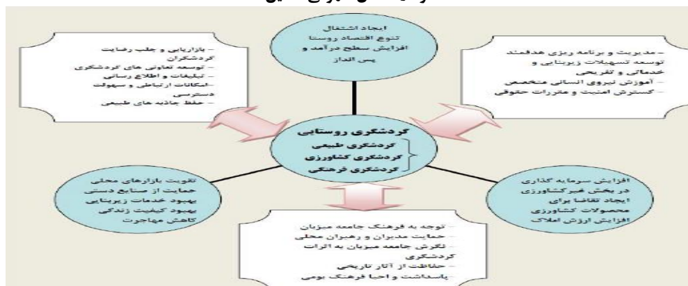
نمودار ۱: مدل مفهومی تحقیق

استخراج نگارندگان از: فضیله خانی و همکاران، ۱۳۹۱، ۸