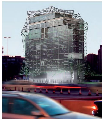
هتل هیبیتات اسپانیا استفاده از مصالح هوشمند ساطع کننده نور LED و سلول های خورشیدی