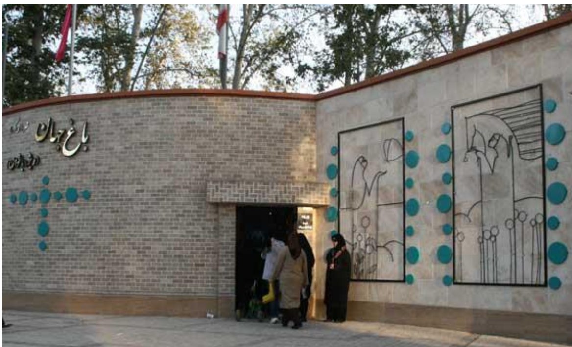
تصویر ۱: ورودی پارک بانوان جهان کرج

باغ جهان در زمینی به مساحت ۵۵۰۰۰ مترمربع به عنوان نخستین پارک بانوان کلانشهر کرج و با همت سازمان پارکها و فضای سبز شهرداری کرج در تاریخ ۶ آذر ۱۳۸۹ افتتاح و به بهره برداری رسید.