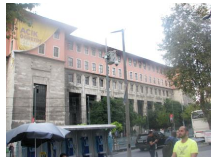
شکل 3- دانشکده علوم استانبول (ماخذ: نگارندگان) شکل 4- موسسه بیمه اجتماعی (ماخذ: نگارندگان) شکل 5- مجمع تاریخ ترکیه (ماخذ: سایت بنیاد بین المللی آقاخان)