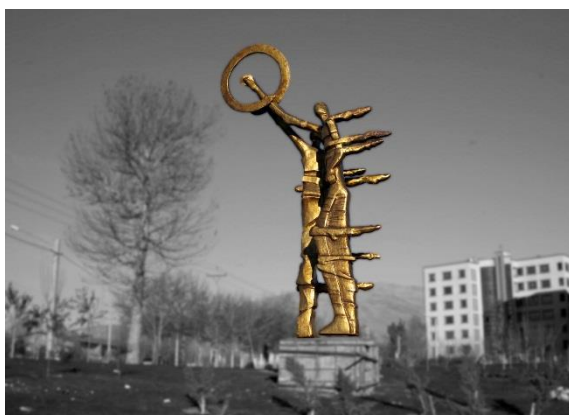
2. المان وحدت