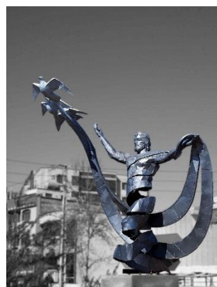
1. المان رهایی