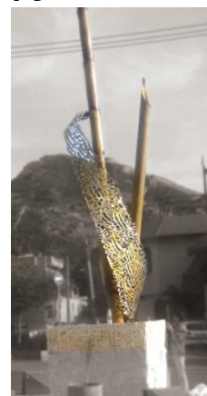
3. المان نیستان