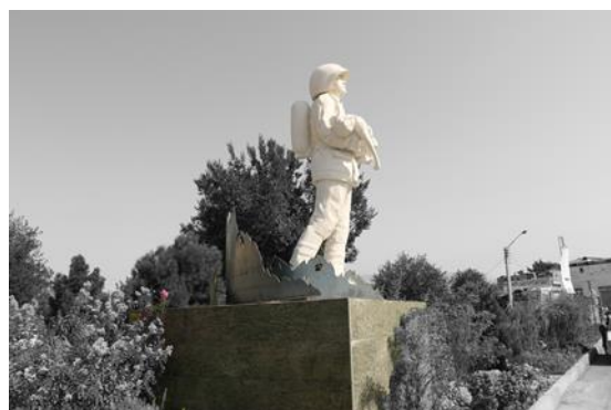
4. المان آتش نشان