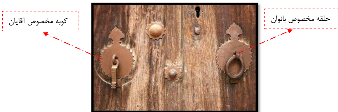
شکل 4 تفکیک جنسیتی در نوع کوبه‌های در ورودی خانه‌ها

و معبر متمایز کند، در بسیاری از بناهای عمومی و بناهای مسکونی بزرگتر، به چشم می‌خورد و به صورت فضای رابط میان معبر و دهلیز ورودی خودنمایی می‌کند. این فضا علاوه بر کارکرد ارتباطی، فضایی برای توقف، انتظار و گفتگو نیز بوده است. در بعضی موارد، در دو سمت آن سکوهایی برای نشستن تعبیه شده و از آن برای استقبال یا بدرقه میهمانان نیز استفاده می‌شده است. در بسیاری از بناهای گذشته از جمله منازل مسکونی و بناهای عمومی که از حرمت و قداست برخوردار بودند، فضای ورودی به گونه‌ای تعبیه می‌شد که مردم مستقیماً و یکباره وارد بنا نمی‌شدند. بلکه پس از ورود به هشتی و مشاهده بخش محدودی از فضای داخلی بنا از طریق روزن باز یا مشبک تعبیه شده در یکی از دیوارها یا بدنه هشتی به یکی از دالان‌های واقع در طرفین هشتی وارد شده و پس از آن به حیاط و سایر فضاهای درونی بنا داخل می‌شدند. در واحدهای مسکونی غالباً فضای ورودی به گونه‌ای طراحی و ساخته می‌شد که از داخل آن و حتی از درون هشتی امکان مشاهده فضاهای داخلی وجود نداشت. زیرا که حریم خصوصی افراد خانواده بود و نمی‌بایست در معرض دید افراد غریبه قرار گیرد. در برخی از خانه‌ها نیز حیاط اندرون، در جداگانه‌ای داشت و همچنین گاهی در فاصله حیاط و دالان، در جداگانه‌ای تعبیه می‌شد [3] اهمیت محرمیت و حفظ حرمت موجب شده بود که برای مردان و زنان، دو کوبه جداگانه و با شکل‌های معین بر روی لنگه‌های در نصب گردد. کوبه‌ای که صدای بزم داشت مختص مردان بود و کوبه‌ای که صدای زیر داشتن مختص زنان. این تمایز سبب می‌شد که ساکنان خانه و بویژه کسی که برای باز کردن در می‌رفت از صدای کوبه جنس مراجعه کننده را تشخیص داده و برای روبرو شدن با او آمادگی نسبی پیدا کند [17].