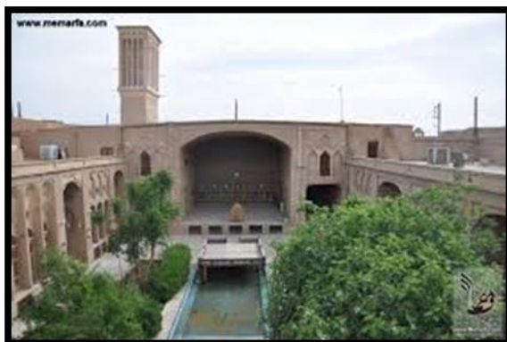
شکل 3 نمونه ای از پیوند معماری با طبیعت در خانه‌های سنتی یزد