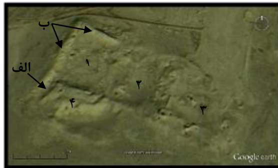
تصویر ۴- بخش‌های مختلف بنا

به منظور درک توصیفات بنا، می‌توان فضاهای معماری آن را به چهار بخش تقسیم نمود. بخش اعظمی از بنا در اثر عوامل طبیعی تبدیل به آوار و تلی از خاک شده است. ارتفاع دیوارهای باقی‌مانده در مرتفع‌ترین قسمت از بخش شماره یک، به ۴ متر می‌رسد. در این بخش می‌توان آثاری از فضایی مشابه ورودی، با عرض تقریبی ۳ متر مشاهده نمود که از طریق راهرویی به طول تقریبی ۱۸ متر (تصویر ۴ الف) دسترسی به آن امکان‌پذیر بوده است.