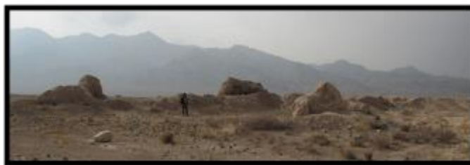
تصویر ۶- نمای کلی برج‌ها و سازه میانی بخش سه (دید از شمال شرق)

بخش چهارم بنا از طریق دیوار جنوبی بخش یک، به بنا متصل است و طبق تصاویر ماهواره‌ای و هوایی ورودی مجزایی از این قسمت به بخش میانی (شماره ۲) قلعه باز می‌شود. در حال حاضر این بخش نیز هم‌چون سایر بخش‌های قلعه به تلی از خاک تبدیل شده است. بخش میانی (شماره ۲) قلعه کاملاً تخریب شده است. اما بخش شماره سه اطلاعات ارزشمندی در ارتباط با بنا در اختیار بیننده آن قرار می‌دهد. از جمله، ویژگی برج‌های بنا و ابعاد دیوارها و خشت‌های موجود در برج، به-علاوه سازه‌ای در میان این بخش که کاربری آن در حال حاضر نامشخص است و نیاز به کاوش دارد. از جمله ویژگی‌های برج‌ها می‌توان به پلان دایره آن اشاره نمود که در اضلاع میانی و در چهار گوشه‌ی این بخش وجود داشته و در حال حاضر تنها بقایایی از دو برج آن موجود است. ارتفاع باقی‌مانده برج‌ها ۳ متر و ضخامت دیوارهای متصل به برج‌ها ۱۲۰ سانتی‌متر است (تصویر ۶).