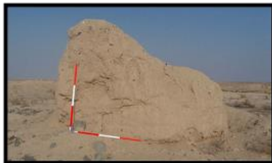
تصویر ۷- سازه میانی بخش سه (دید به شمال)