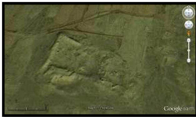
تصویر ۲- پلان کلی قلعه سفید

وسعت تقریبی بقایای به جا مانده از مجموعه اراضی طسمی جان حدود ۳۰۰ هکتار و وسعت قلعه سفید در آن، یک هکتار است. براساس مطالعات نمونه های سفالین پراکنده در سطح اراضی طسمی جان، قدمت استقرار در آن، به دوران پیش از تاریخ تا دوره قاجار می رسد. ساختار و نقشه کلی قلعه منظم و مستطیل و دارای جهت ساختاری شمال غربی- جنوب شرقی و ساختار معماری آن بر برج و باروهای بلند استوار است (تصویر ۲).