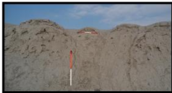
تصویر ۵- قوس‌های هلالی دیوارهای بخش یک (دید به شمال شرق)

بخش چهارم بنا از طریق دیوار جنوبی بخش یک، به بنا متصل است و طبق تصاویر ماهواره‌ای و هوایی ورودی مجزایی از این قسمت به بخش میانی (شماره ۲) قلعه باز می‌شود. در حال حاضر این بخش نیز هم‌چون سایر بخش‌های قلعه به تلی از خاک تبدیل شده است. بخش میانی (شماره ۲) قلعه کاملاً تخریب شده است. اما بخش شماره سه اطلاعات ارزشمندی در ارتباط با بنا در اختیار بیننده آن قرار می‌دهد. از جمله، ویژگی برج‌های بنا و ابعاد دیوارها و خشت‌های موجود در برج، به-علاوه سازه‌ای در میان این بخش که کاربری آن در حال حاضر نامشخص است و نیاز به کاوش دارد. از جمله ویژگی‌های برج‌ها می‌توان به پلان دایره آن اشاره نمود که در اضلاع میانی و در چهار گوشه‌ی این بخش وجود داشته و در حال حاضر تنها بقایایی از دو برج آن موجود است. ارتفاع باقی‌مانده برج‌ها ۳ متر و ضخامت دیوارهای متصل به برج‌ها ۱۲۰ سانتی‌متر است (تصویر ۶).