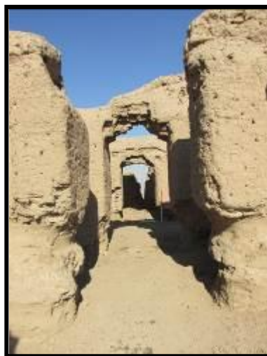
تصویر ۸- بخشی از کاروانسرای امین آباد

معماری کاشان وام‌دار گذشته و گذشتگان است، چرا که برخی از سنت‌های به جای مانده از معماری سیلک (به عنوان کهن‌ترین آثار معماری به‌دست آمده تا به امروز از کاشان)، در طول دوران تاریخی و اسلامی، همچنان تداوم داشته است؛ این استمرار در سنت‌های قدیمی را که در محوطه قلعه سفید نیز قابل مشاهده است، می‌توان در چند زمینه مشاهده کرد. نخستین مورد به نوع مصالح ساختمانی ارتباط دارد. در بناهای محوطه سیلک که متعلق به پیش از تاریخ است و در سازه قلعه سفید (متعلق به دوره تاریخی)، شواهد استفاده از خشت و گل به عنوان اصلی‌ترین ماده‌ی ساختمانی و همچنین دیوارهایی با ضخامت ۱۲۰ سانتی‌متر، قابل مشاهده است و در بناهای دوره اسلامی از جمله کاروانسرای امین آباد (تصویر ۸) و قلعه جلالی، ادامه استفاده از خشت آشکار است و به نوعی سنت تبدیل شده است.