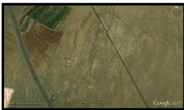
تصویر ۱- موقعیت قرارگیری اراضی طسمی جان در منطقه

اراضی طسمی جان در موقعیت جغرافیایی "۳۴°۰۷،۹۷۱" عرض شمالی و "۵۱°۱۷،۱۶۹" طول شرقی و ۸۷۱ متر ارتفاع از سطح آب های آزاد و در ۱۶ کیلومتری شمال شهر کاشان و در میان مسیرهای ارتباطی (جاده و بزرگراه) کاشان به قم و محوطه قلعه سفید در آن قرار دارد (تصویر ۱).