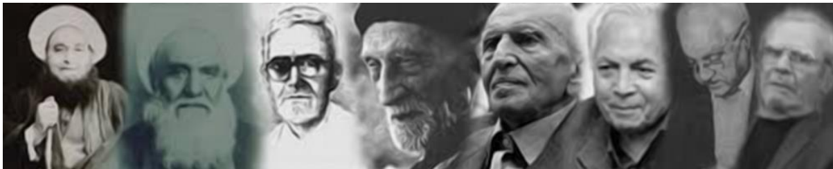
بزرگان اهل علم و ادب شهر بیرجند

در شهرهای ایرانی شیفتگی به مظاهر غیر بومی و فراموشی سهوی و عمدی هویت بومی به وفور مشاهده می شود. بیرجند شهری است که دارای پیشینه ی تاریخی و فرهنگی غنی است اما میدان های ایجاد شده در آن چیزی از هویت و تاریخچه شهر و مردم این منطقه به نمایش نمی گذارند. بی شک اثرگذاری میدانی با تندیس یکی از بزرگان اهل علم و ادب شهر همچون مولانا عبدالعلی بیرجندی، ریاضیدان و ستاره شناس سده ۹ هجری قمری . ابن حسام خوسفی، شاعر سده ۹ هجری قمری ، حکیم نزاری قهستانی، شاعر سده ۷ هجری قمری ، امیر شوکت الملک، امیر قائنات و شخصیت مهم سیاسی در دوران قاجار و پهلوی