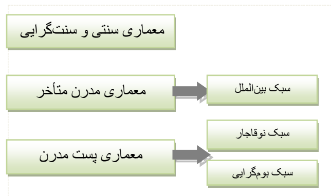
شکل ۲- سبک‌های معماری در دهه‌ی اول انقلاب اسلامی (ماخذ: قبادیان، ۱۳۹۴)

در برخی جوامع پس از ورود مدرنیته، شهرها براساس تقلیدهای بدون اندیشه از مکاتب غربی و بدون توجه به الگوهای بومی و نیاز کاربران ساخته شدند، که این خود بی‌هویتی به همراه دارد. اما استفاده از مدرنیته، حفظ الگوهای سنتی ساخت و ساز و در نظر گرفتن نیاز کاربران و منطقه، راهی است که شهرهایی با اصالت به وجود می‌آورد. این راهی است که معماری ایرانی-اسلامی طی نموده است. معماری جمهوری اسلامی ایران در دهه‌ی اول انقلاب را مطابق با شکل ۲ می‌توان به سه بخش تقسیم کرد: