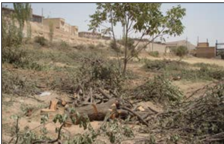
تصویر ۲: تخریب باغ در روستای حسن آباد، ۱۳۸۷.

پادگانها، صنایع پراکنده، شرکتهای صنعتی، تعاونی های مسکن و تأسیسات و تجهیزات شهر سنندج اعمال شده است. در روند این تغییرات در مجموع ۱۶/۱۶۱۹ هکتار اراضی زراعی، باغی و مرتع تغییر کاربری یافته و تبدیل به کاربری های دیگر شده اند (جدول ۱۰ و نقشه ۲).