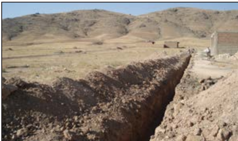
تصویر ۱: تخریب زمین زراعی در روستای قار، ۱۳۸۷.