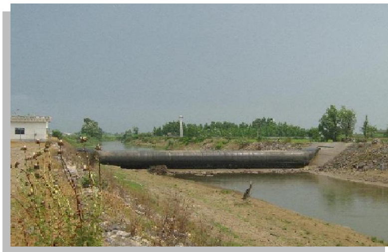
شکل (۳): تصویر سد لاستیکی عرب خیل در فصل کم آبی

در شکل (۳) تصویری از سد لاستیکی عرب خیل در فصل کم آبی مشاهده می شود که در قسمت بالا دست به علت خشک شدن رودخانه بتن پی سد هم قابل مشاهده است، اما آبی که در پایین دست سد مشاهده می شود در واقع آب شور دریای است. در هنگام کم آبی سطح تراز آب دریا بالاتر از سطح تراز آب شیرین رودخانه قرار می گیرد و این امر می تواند سبب شور شدن اراضی کشاورزی منطقه شود.