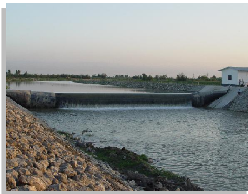
شکل (۱): تصویر سرریز آب از روی سد لاستیکی عرب خیل

در شکل (۱) تصویری از سد عرب خیل در فصل پر آبی مشاهده می‌شود که آب بالا دست در حال سرریز از روی سد می‌باشد.