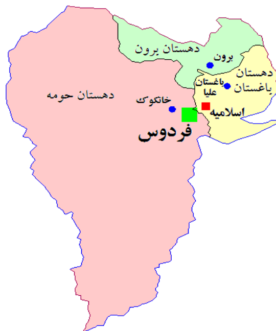
نقشه ۱: موقعیت روستای برون در شهرستان فردوس [۱۱]

ضمنی در کنار یک سری مشاغل اداری روستا، باتوجه به اینکه در فاصله ۴ کیلومتری روستای برون معدن گچ سفید قرار دارد، لذا در صورت بهره برداری زمینه اشتغال جدید، نیز فراهم خواهد شد. [۱۰]